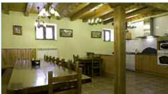
Las amplias dependencias atraen a grupos numerosos.