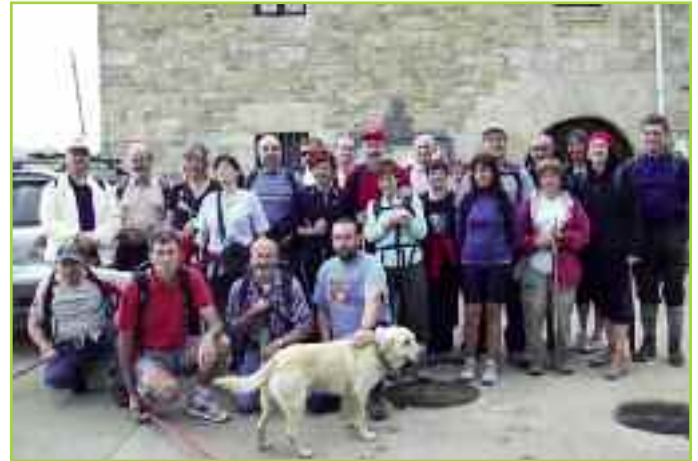
Foto de casi todos los valientes que recorrieron la marcha íntegra.

En definitiva, un buen punto de partida para futuros Días de la Mancomunidad. Somos muchos y estamos muy repartidos, pero ya nos conocemos un poco más que antes del sábado 23 de mayo. El año que viene, más y mejor.