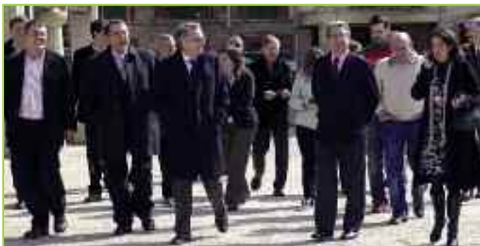
Paseo de autoridades por las calles de Urroz-Villa.

Por su parte, Miguel Sanz puso a la Mancomunidad Izaga como ejemplo de buena gestión dentro de la administración local.