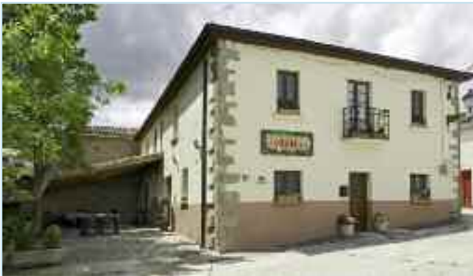
Fachada de la Casa Rural Lantxurda, en Abínzano.