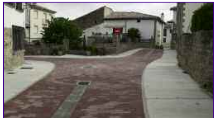
Tres imágenes de las nuevas calles en el centro de Salinas.