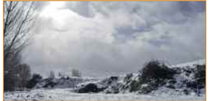
La fuente de Reta, casi tapada por una de las nevadas del invierno.