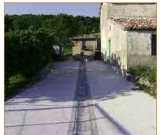
Dos imágenes de las calles de Idoate, ya arregladas.