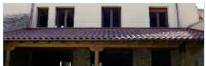
Detalle del salón y porche exterior de las casas.