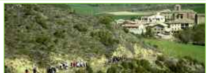
Paseo "conozcamos nuestro valle" con Artai al fondo.

Se puede contactar con este grupo en philaeconsort@gmail.com .