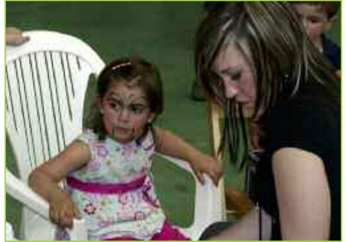
Imagen general de la comida popular en el frontón de Monreal y animación infantil para los más pequeños.