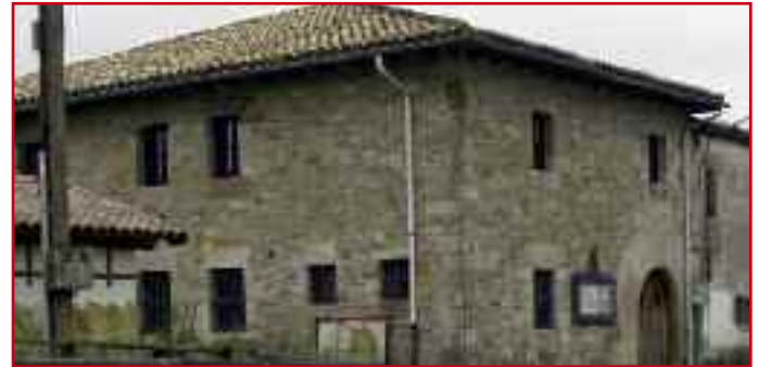
Imagen del Ayuntamiento de Lizoain-Arriasgoiti, sede del Día del Valle.

Con estas tareas cumplidas, llegará la comida popular, este año con menú a base de ensalada mixta, langostinos, fritos variados, ajoarriero, cordero al chilindrón y bizcocho. El precio