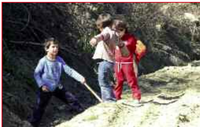
Imagen del Día del Árbol, celebrado en marzo en Lerruz. Como se observa, la juventud viene pegando fuerte y ya tira de azada.