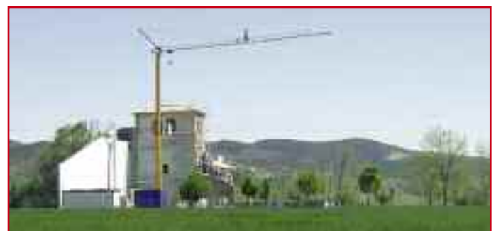
La Iglesia de Lizoain, a primeros de mayo.

Con esta oportuna subvención se continuarán los trabajos de consolidación del edificio.