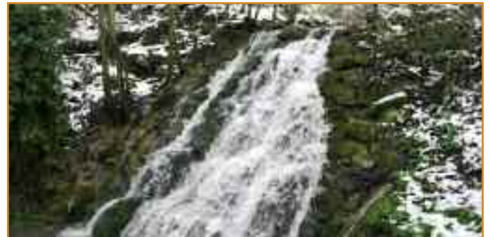
Comienza la primavera y el deshielo. Cascada en Reta.