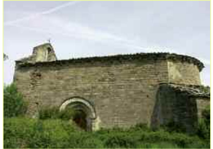
Como se observa, la Iglesia se encuentra en claro abandono.