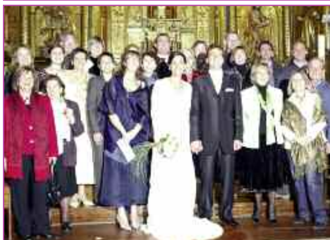
Arriba, la Coral de Monreal en plena actuación. Debajo, junto con los novios en una boda.

do el repertorio aunque de ensayar más iríamos más rápidos. Sólo 4 ó 5 estamos desde el principio, y somos un grupo en que todos nos tratamos de igual a igual. De hecho, a mitad de ensayo hacemos un descanso-tertulia en la que todo el mundo habla".