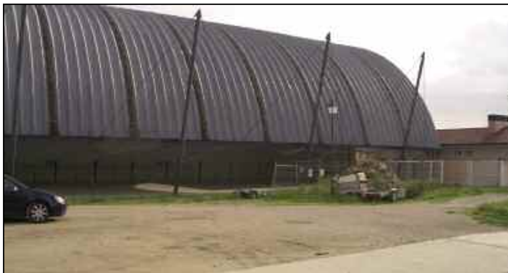
Plaza junto al frontón que se va a urbanizar con el Fondo Estatal de Inversión Local.

Con este proyecto, cuyo inicio está previsto para mediados del mes de junio, se acondicionará mediante hormigón con encintado de adoquín la parte comprendida entre el campo de