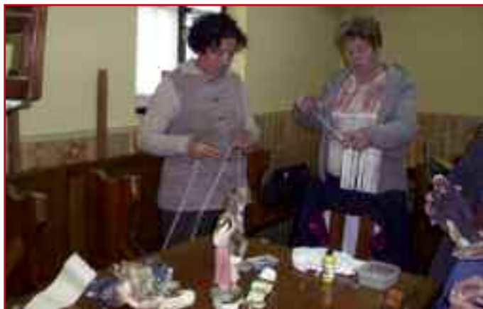
Los sábados de abril y mayo han acogido sendos cursos de manualidades (en la foto) y cocina.