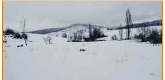
Monte de Leguin, repleto de nieve.