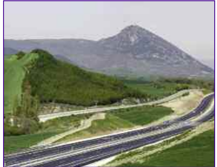
Imagen del nuevo tramo abierto al tráfico, visto desde Izco.

Para el valle de Ibargoiti supone la culminación de la obra a su paso por su territorio (7 Km y medio y 600.000 m2 por el fondo