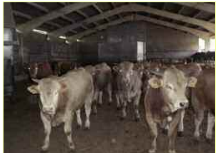
Aspecto exterior e interior de la explotación.