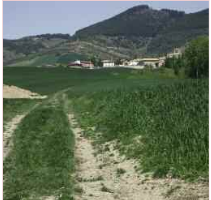
Arranque del camino en Uroz. Al fondo, Mendióroz.

Las obras empezarán en breve y tienen que estar acabadas antes de final de este mismo año para no perder la subvención del Fondo Estatal.