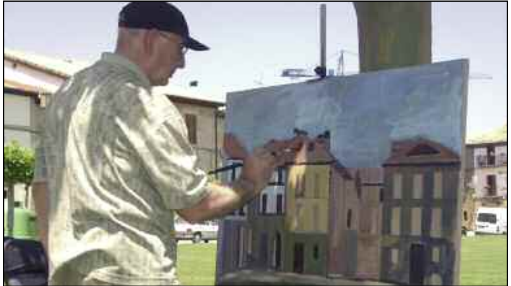
Una imagen del Concurso de pintura al aire libre de Urroz-Villa del año pasado.

Los participantes aportarán el caballete y todos los