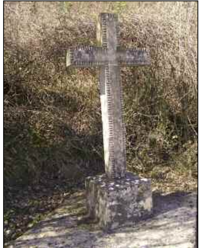
Un monumento se erige actualmente en el lugar del fatal suceso. Debajo, el Monte Argonga visto desde Urroz-Villa.

Por ello, el Ayuntamiento de Urroz-Villa quiere hacerse eco de la fecha señalada (21 de agosto) y realizar un acto de conmemoración del fallecimiento. El acto o actos que se programen se concretarán con anterioridad con la familia y se anunciarán oportunamente.