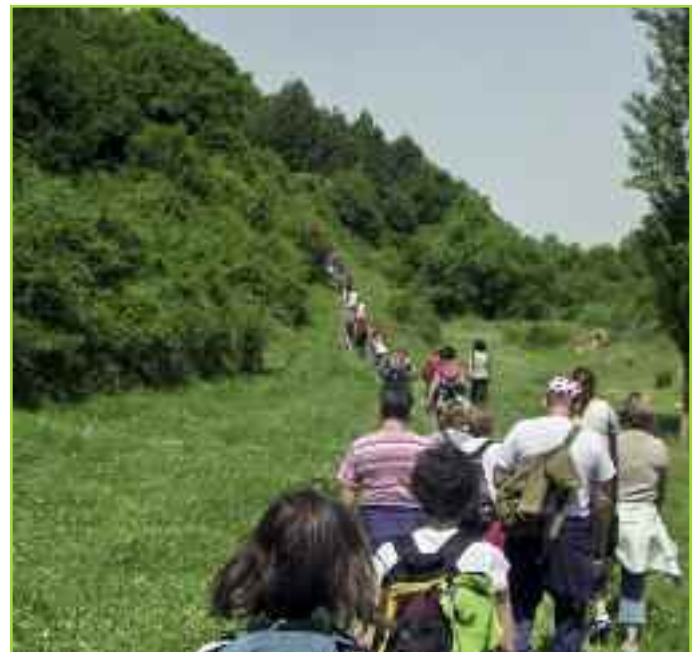
Un momento de la marcha por los terrenos de la Mancomunidad, una iniciativa muy bien recibida.