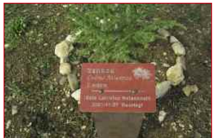
Uno de los carteles que se pusieron el pasado 12 de diciembre.