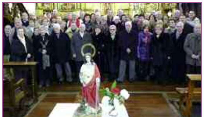
Los mayores de la localidad, el día de Santa Bárbara.