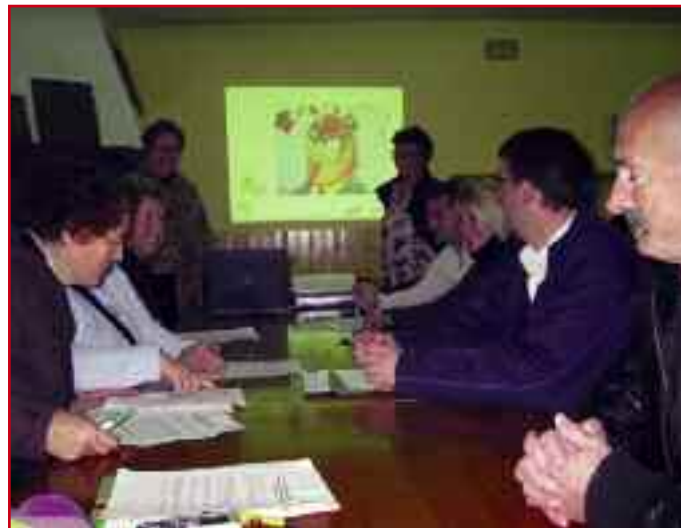
Uno de los talleres del grupo, en Lizoáin.

Las personas del Valle que se han apuntado han asistido a una serie de talleres que han tratado sobre calefacción y agua caliente, electrodomésticos y eficiencia energética, consumo responsable y conducción eficiente.