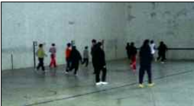
Los mayores de Urroz-Villa, en plena actividad.

La actividad ha tenido buena aceptación y ha sido necesario organizar dos grupos para dar cabida a todas las personas interesadas. A buen seguro los juegos y las actividades de coordinación motriz van a hacer que nuestros mayores funcionen como un reloj.