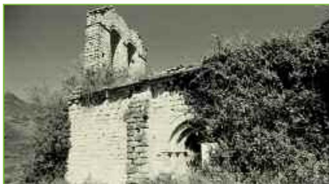
Iglesia de San Pedro (Muguetajarra) al inicio de la década de los 70.

Con el Franquismo, la Ley Hipotecaria de 1946 facili-