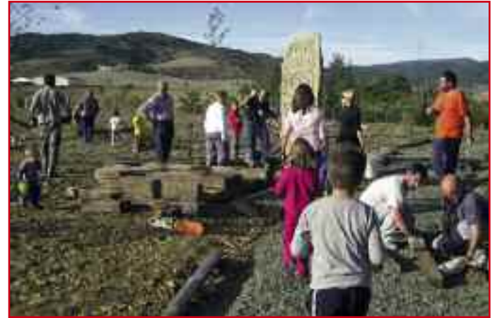
Ambiente de trabajo en uno de los auzolanes.

Una vez acabado todo, está previsto hacer una jornada de inauguración. Cuando empiecen a brotar las hojas de los árboles y esté acabado el círculo, en marzo o abril, tendrá lugar el evento, del que se informará oportunamente.