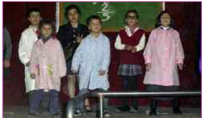
Un momento de un festival navideño pasado.