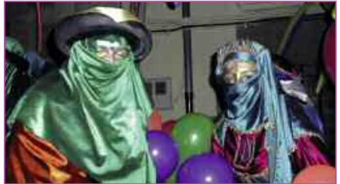
Los pajes de los Reyes exhiben sus mejores vestimentas.