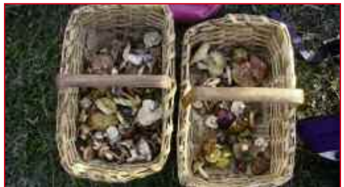
Algunos de los interesantes ejemplares recogidos.