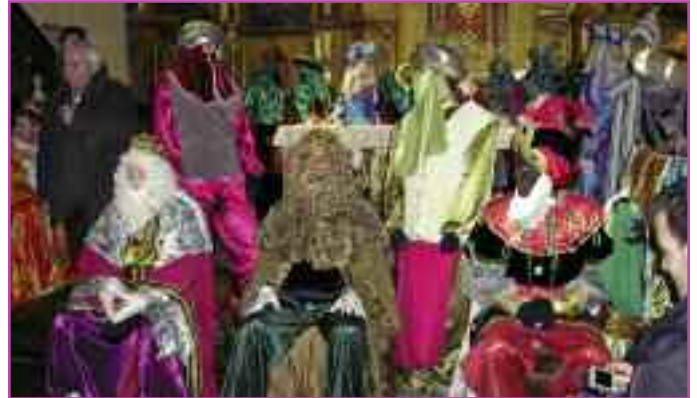
Sus Majestades, en la Iglesia durante una Noche de Reyes anterior.