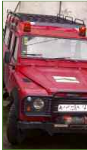
La flota de la Mancomunidad Izaga cuenta ya con dos vehículos más. Seguimos mejorando en material.