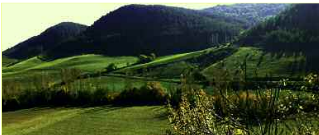
Instantánea de un bello paraje de Izagaondoa.