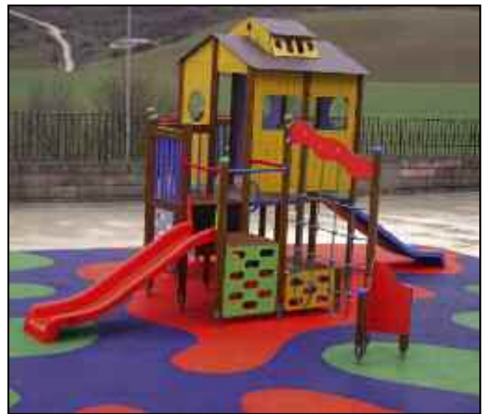
Nuevo parque infantil en Urroz-Villa.

Estas obras tuvieron un bonito colofón con la decoración mediante un grafiti de tres tramos de pared que dan un aspecto mucho más agradable al patio escolar. Fueron los jóvenes los que se encargaron de contactar con los grafiteros y la pintura la puso el Ayuntamiento. Esa mañana de fiestas fue curioso verlos cómo avanzaban en su trabajo hasta completar el mural.