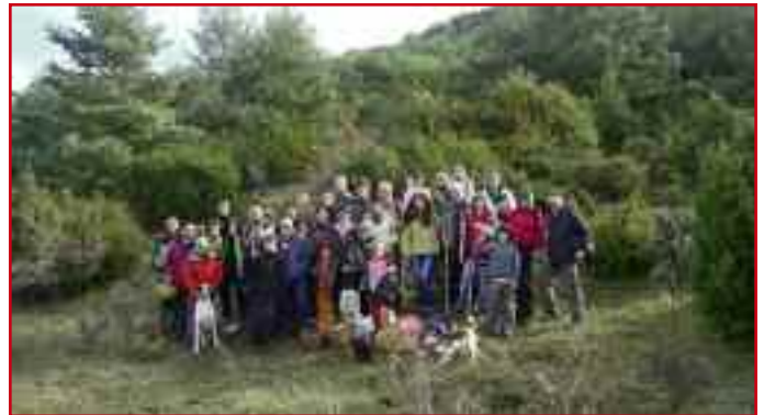
Foto de grupo de los participantes en la salida.