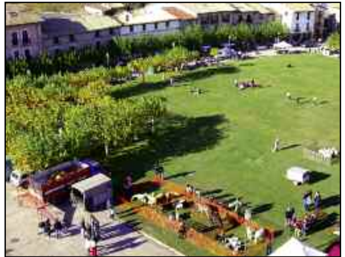
La feria vista desde la torre de la iglesia.

Los puestos de artesanía en sus diferentes modalidades continúan en aumento, con una oferta mayor en número y en variedad de las actividades artesanales. Van ganando protagonismo cuestiones relacionadas con productos ecológicos en sus diferentes variedades tales como la miel, repostería y objetos realizados con