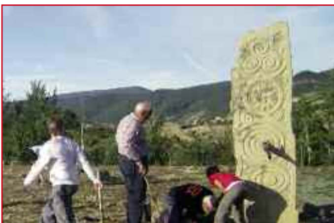
A la derecha, la piedra que sirve de original fuente.

En la actualidad no existe un parque o entorno semejante que pueda servir de solaz, descanso, o punto de encuentro al aire libre. A nivel de niños y niñas, aún es más importante darles ocasiones de encuentro.