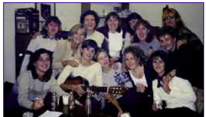
Cena en Salinas, unos años atrás.