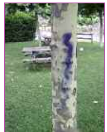
Imagen de las pintadas aparecidas en varios elementos públicos de Monreal.