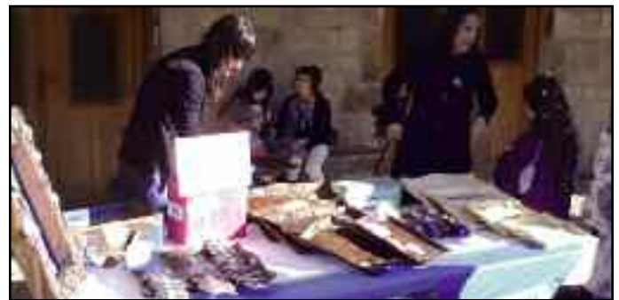
Actividad solidaria en torno al puesto del Colegio Público.

Vayan desde las páginas de esta revista nuestro reconocimiento y nuestra enhorabuena en nombre de todo el pueblo.