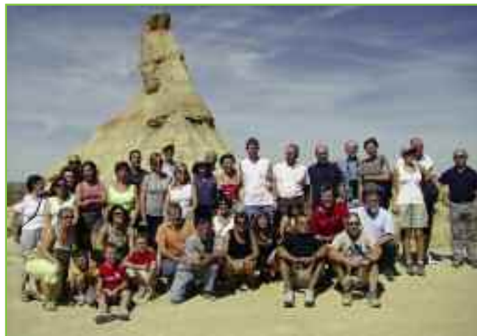
Vecinos del Valle de Unciti en Castildetierra (Bardenas Reales).

Desde que la Casa de Cultura inició su funcionamiento a finales del año 2007, hemos tratado de financiar la totalidad de las actividades programadas con la subvención del Gobierno de Navarra en su programa "Organización de programas de difusión cultural", y con los fondos obtenidos del programa "Tú eliges, tú decides" de Caja Navarra y que los costes de mantenimiento y conservación fueran soportados por el presupuesto ordinario del Ayuntamiento. En estos tres años y medio lo hemos logrado.