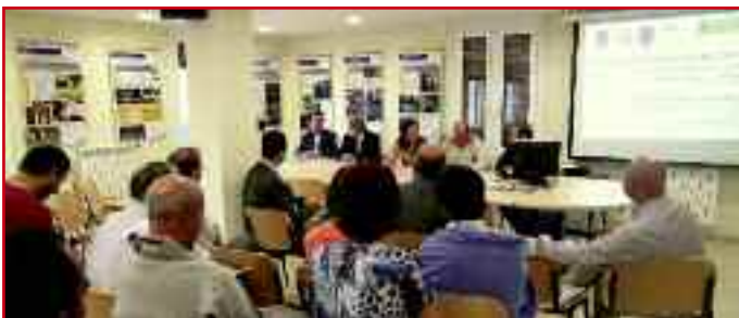
Presentación de la exposición en Unciti.

Estos grandes resultados a nivel regional, nacional e internacional animaron a Ripakoa, junto a Josenea, de Lumbier y también reconocida, a traer a la Casa de Cultura de Unciti una exposición itinerante con los proyectos elegidos de entre todo el país.