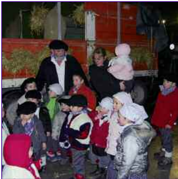
Imagen de un Olentzero en Izco.

Este año, Izco también recibirá la visita de nuestro peculiar Olentzero.