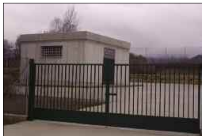
Estación de bombeo, junto a la carretera de Monreal.

para poder iniciar los trámites necesarios hasta culminar estas labores. Se trata de una obra menor en comparación con la solución Mendinueta, que afecta exclusivamente al municipio de Urroz y que también contará con financiación a cargo del Fondo de Libre Disposición mencionado más arriba.