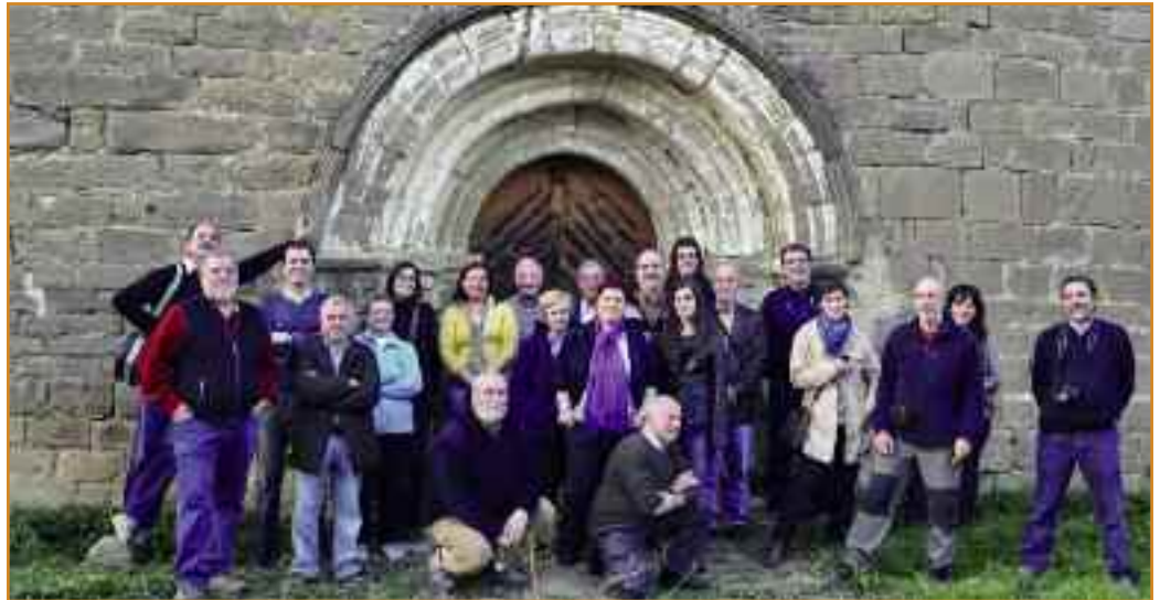
Parte de los participantes en el primer Día del Románico del Valle de Izagaondoa.

La visita comenzó a las 9.30 horas en la Sociedad