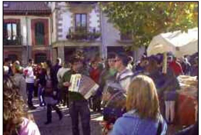
Música, artesanía y fiesta en la feria.

materiales reciclados. También se afianza el carácter artesanal de nuestra feria y año a año gana protagonismo en el calendario local y comarcal.