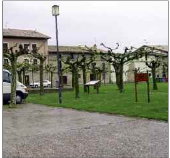
Fotografía de la plaza El Ferial. Pueden apreciarse los paneles de madera para que los perros no defecuen en la hierba, así como una furgoneta aparcada en el borde.

Otras consecuencias inabordables para un ayun-