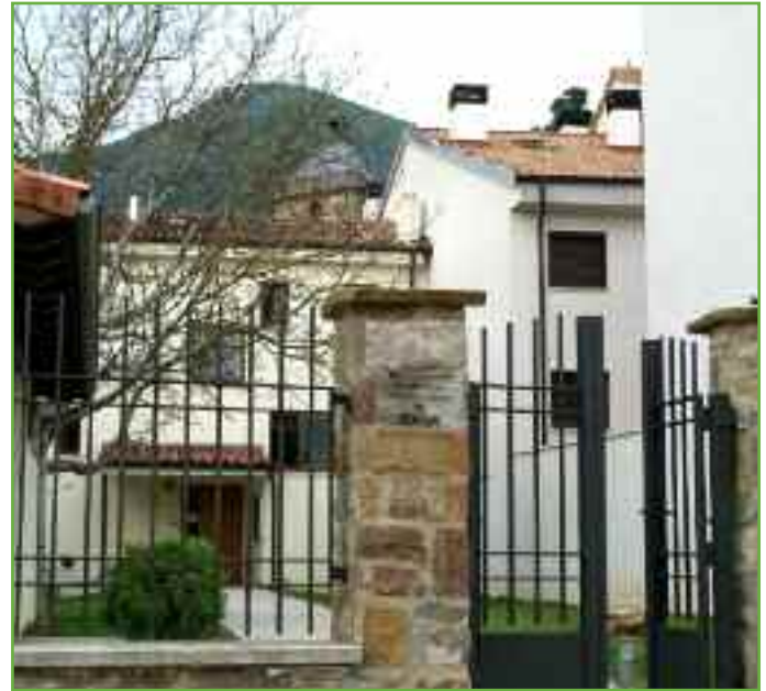
Entrada a las oficinas de la Mancomunidad en Monreal.

A los ciudadanos se les anima a llamar al 012 para evitar desplazamientos innecesarios, presentar la documentación correcta, no acudir al Ayuntamiento el día que vencen los plazos o en horas punta y respetar los horarios.