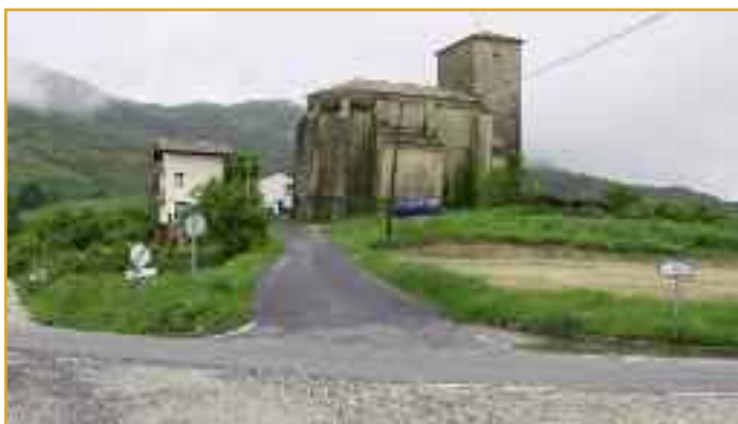
El cruce de Reta, en una imagen del pasado mes de mayo.

contará con una subvención del 60% del anterior plan trienal. Los trabajos se prolongarán durante meses y darán más de un quebradero de cabeza a los vecinos, si bien se trata por una buena causa y se espera que a la conclusión de los mismos desaparezcan los problemas de agua.