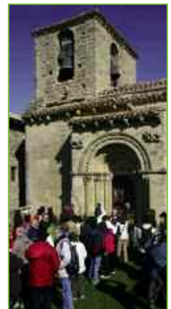
Iglesia de Artáiz.