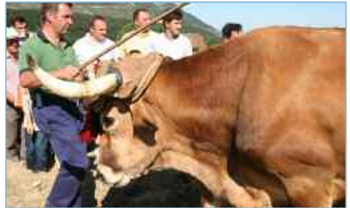
Como se observa en ambas imágenes, el Día de la Trilla recrea tareas agrícolas de otra época.

El próximo domingo 27 de julio, otros tiempos agrícolas se adueñarán de la localidad de Salinas. Este tranquilo pueblo del Valle de Ibargoiti se convertirá en un hervidero de personas dispuestas a pasar un día alegre y plagado de actividades. El principal acto es una recreación de la trilla, o la operación que se hace con los cereales, tras la siega o cosecha, para separar el grano de la paja.