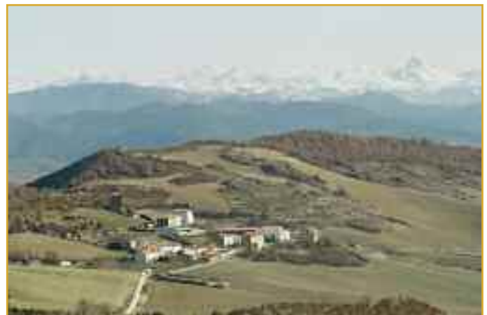
Vista del pueblo de Idoate.

También se asfaltó la otra entrada del pueblo, y se solucionó un problema de corrimiento del firme en Induráin.