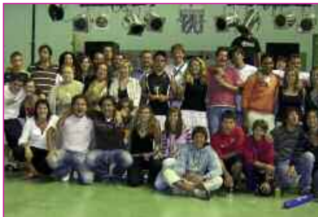
Una entrega de premios del Día de la Piscina en Monreal.