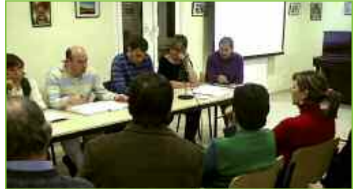
Un momento de la iniciativa “Tengo una pregunta para... el Ayto”.

En el mes de enero se organizó una actividad novedosa y se programó la reunión “Tengo una pregunta para.... el Ayuntamiento de Unciti”, en la que los residentes en el valle pudieron realizar a la corporación municipal