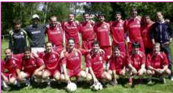
Plantilla del Elomendi para su debut en la Copa, esta temporada.