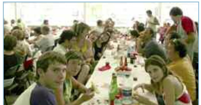
La comida popular, todo un éxito de participación. mendienarteko.org

Se trata, en definitiva, de buscar una excusa para la reunión de los vecinos de la zona.