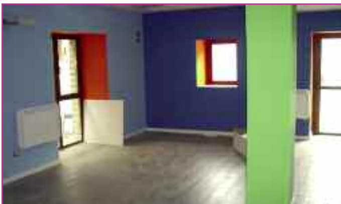
Aspecto de una de las salas habilitadas.

El programa "Tú eliges, tú decides", de la CAN, reportó algo más de 11.000 euros.