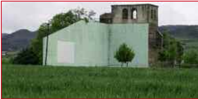
La Iglesia de Lizoáin será reformada como centro cívico. ZC

Se espera que las obras se inicien a finales de mayo.