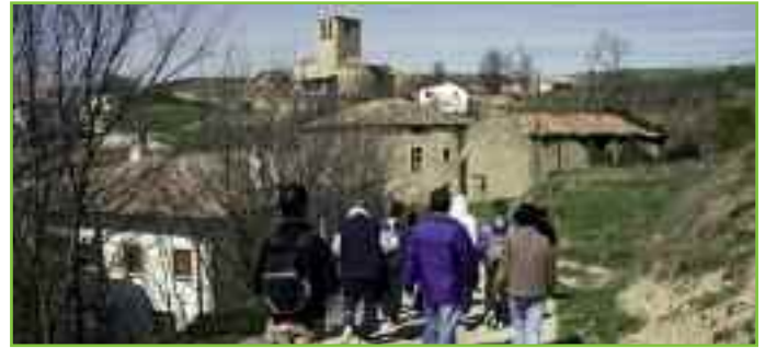
"Paseo por nuestro románico", con la Iglesia de Najurieta al fondo.