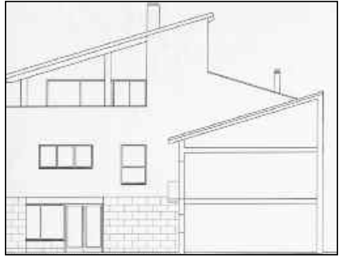
Alzado de lo que será la fachada del Centro Cívico vista desde la Casa parroquial.

dor social para los seis ayuntamientos que componen la Mancomunidad de Servicios Administrativos Izaga.