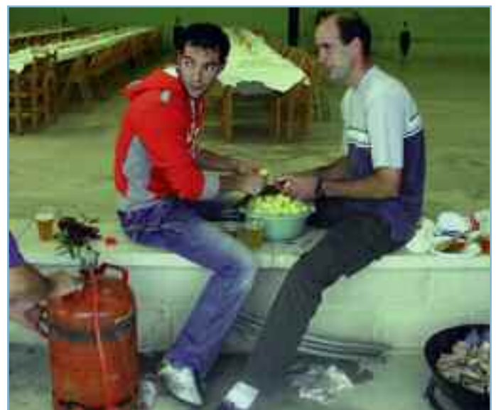
Arriba, representación local en la prueba de Goitibeheras organizada por “Mendienarteko Elkarte” en 2007. Debajo, concurso de caldeteros el día de la inauguración de la sociedad. mendienarteko.org

idea es que sean los sábados de verano, en la sala de proyecciones del Ayuntamiento, en Salinas).