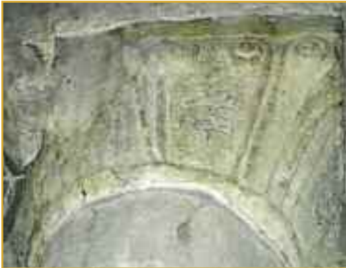
Firma del maestro Petrus grabada sobre uno de los capiteles de la Iglesia de Guerguitiain.