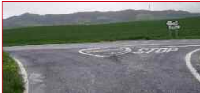
Acceso a los carretilles de Uroz (arriba) y Yelz. ZC

E-mail del Ayuntamiento del Valle de Lizoáin: lizoainarriasgoiti@gmail.com Envíenos sus sugerencias, quejas, dudas... Utilice el teléfono 012 Infolocal