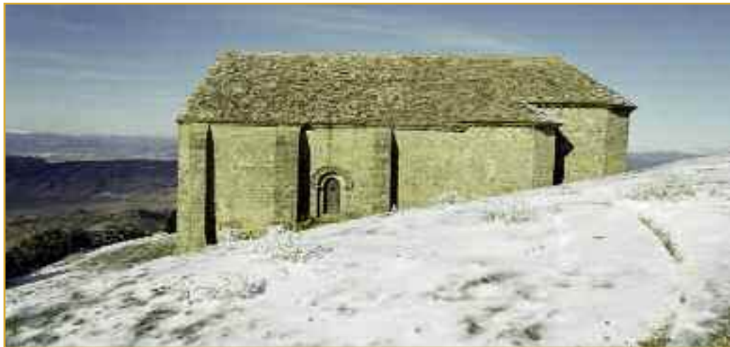
Imagen de la ermita de San Miguel de Izaga.

Como se sabe, los ermitaños eran monjes que fijaban su misión en el cuidado y protección de una ermita dedicada a algún santo y, por lo general, en algún territorio despoblado y poco visitado. El retiro del ermitaño se consideraba