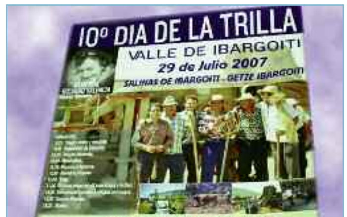
Cartel anunciador del Día de la Trilla celebrado en 2007.