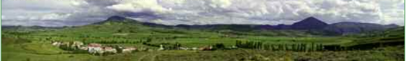
Panorámica del Valle de Unciti, visto desde el término de Unciti