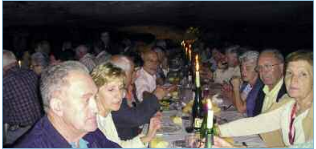
Jubilados de Ibargoiti, comiendo el zikiro en las cuevas de Zugarramurdi a la luz de las velas.

Las salidas resultan a un precio asequible ya que el Servicio Social de Base de Noáin sufraga los gastos de desplazamiento y el Ayuntamiento del Valle de Ibargoiti también colabora, principalmente con el pago de entradas en las visitas que se realizan durante la