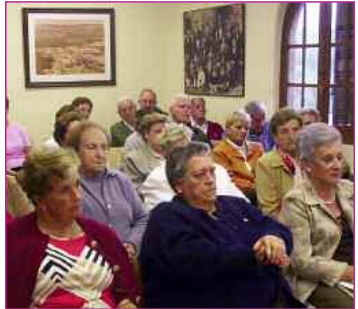
Imagen de archivo de la semana cultural de los mayores.

En todos los programas se llevan a cabo 2 niveles de intervención: individual-familiar y comunitario.