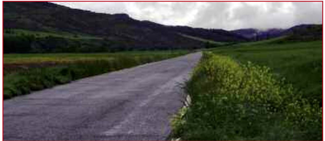
La carretera de Urroz a Erro enfila el Valle de Arriasgoiti a la altura del carretil de Janáriz. ZC

del Valle, hasta entonces retenida entre sus montes y obligada a sobrevivir y autoabastecerse merced a la ganadería, el monte y la agricultura. Fuere como fuere, la verdad es que el número de habitantes fue en claro retroceso a partir de entonces.