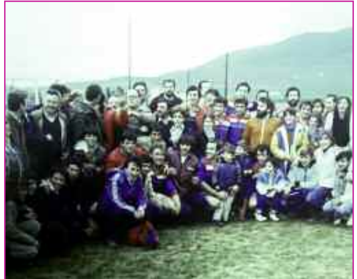
Dos fotografías antiguas del Elomendi. Arriba, celebración junto con el público de una de las copas ganadas por el equipo. Al lado, una de las primeras alineaciones del equipo de Monreal, allá por los años 70.