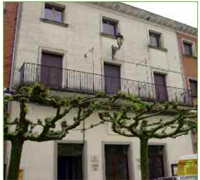
Sede de la Mancomunidad de Servicios Administrativos Izaga en Urroz.

Existen dos sedes administrativas en Urroz Villa y Monreal, a las que pueden acudir los ciudadanos indistintamente, si bien los de Ibargoiti y Unciti acuden