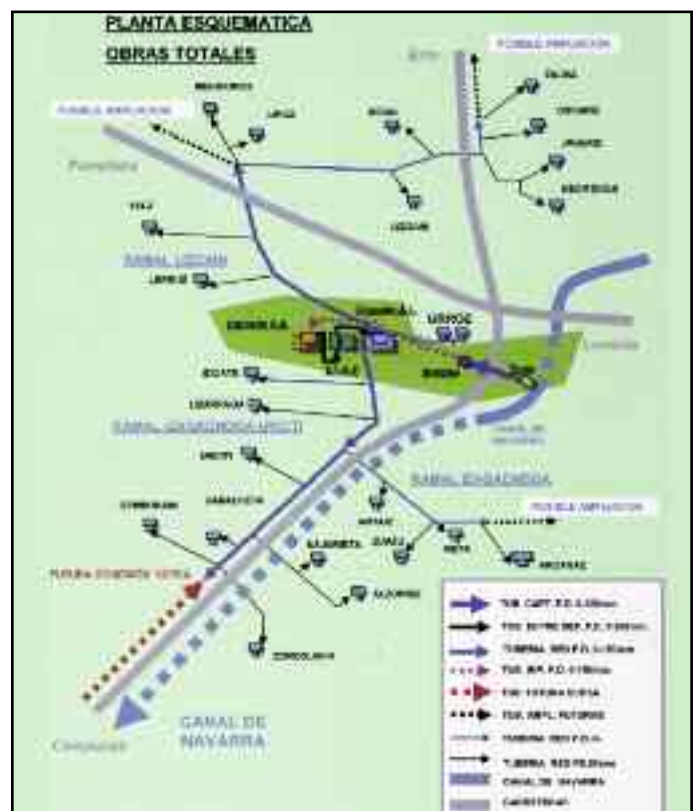
Esquemas de las fases I y II (arriba) y la totalidad de la solución Mendinueta (abajo), facilitados por Sertecna, S. A.