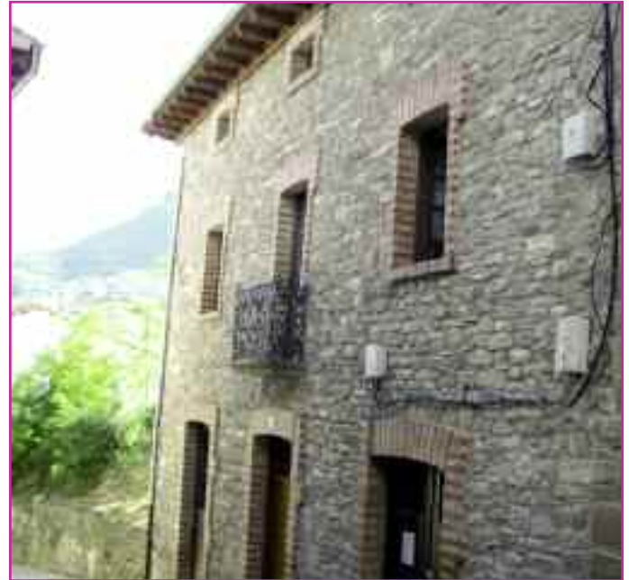
En la imagen superior, la Casa del Maestro, en una vista desde fuera. Debajo, un momento del acto de inauguración, celebrado el pasado 31 de mayo.

Otra de las causas que han motivado que la obra viera notablemente incrementado su coste ha sido la construcción de un muro de contención en la zona del patio para la guardería. En relación con este tema, se ha criticado la falta de espa-