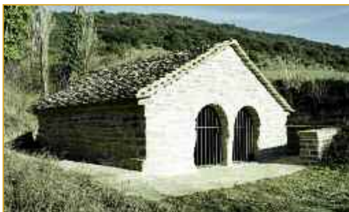
Fuente románica de Turrillas.