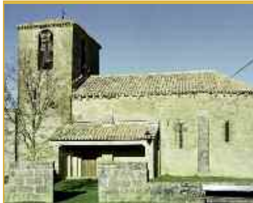
Iglesia de Zuazu.

La Ruta de Petrus ya se desperdiza en los valles de Izagaondoa y Unciti. Se trata de un proyecto ambicioso que el Ayuntamiento de Izagaondoa llevará a cabo con el fin de recuperar todo el patrimonio, en muchos casos olvidado hoy en día, que posee la zona.