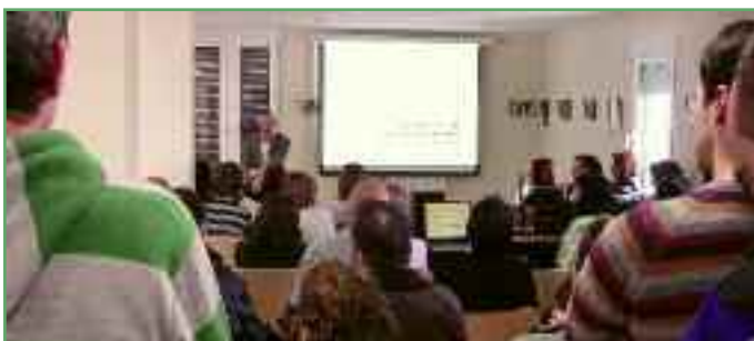
Charla: “Aprendiendo a ser feliz, mejorando nuestra salud mental”.

Al cierre de esta edición se tienen programadas varias actividades para los meses de verano: paseos por el valle, cursos de informática, actuaciones musicales, danza, cine... Será un verano interesante.