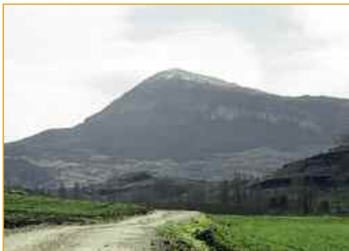
Vista de la Peña Izaga. Un poco antes de su cima está la ermita.

La ermita de San Miguel es iglesia de tres naves, divididas en cuatro tramos, de los que los dos primeros no tienen bóveda. El ábside es poligonal.