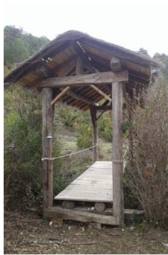
3. Puente en el Biorreta/ Biorretako zubia