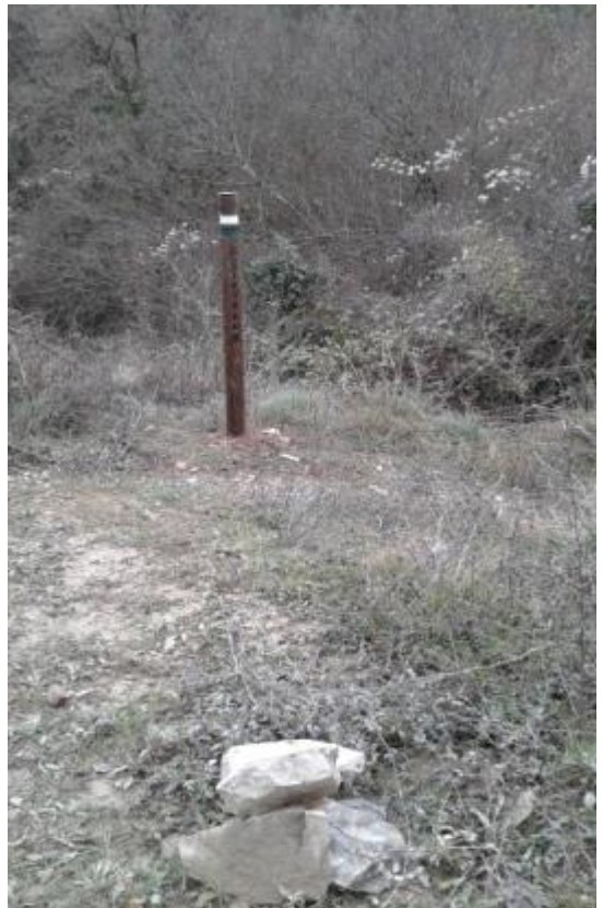
7. Bajamos a Xiringoa/ Xiringoarrantz