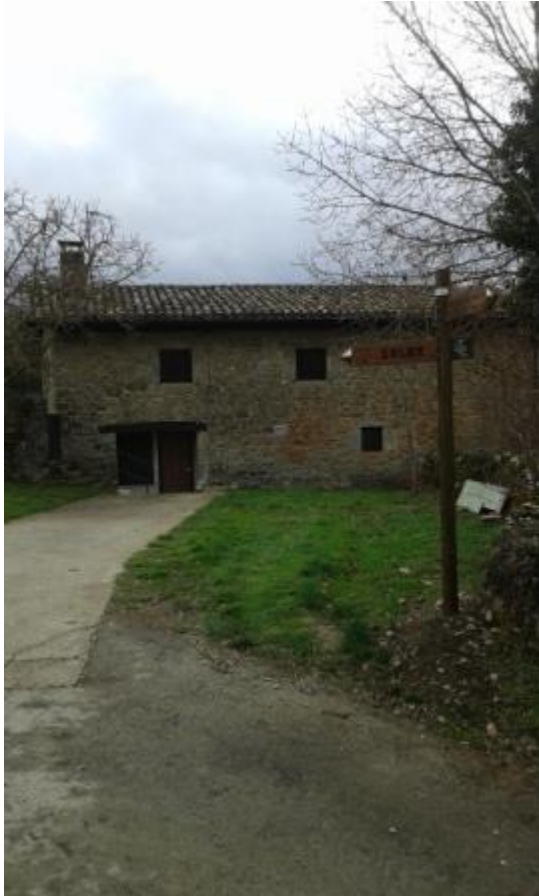
1. Zuntzarren. Inicio/ Hasiera