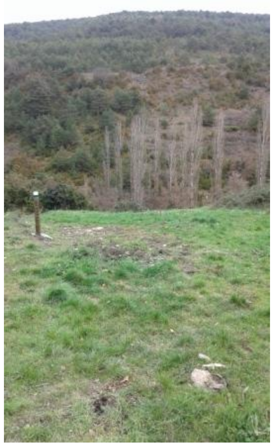
2. Hacia el Biorreta/ Biorreta erreka