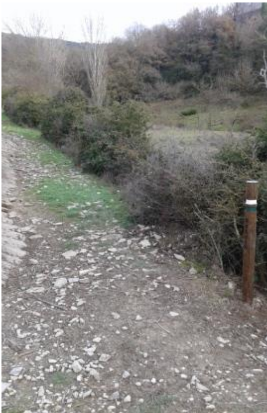
10. Desvío a la izqda. a Zalba/ Eskerretara Zalbarantz