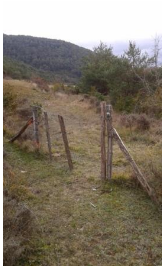
5. Muga de Ilotz/ ilotzeko muga