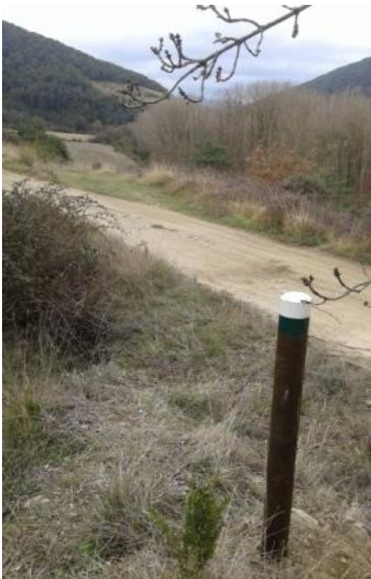
6. Salimos a pista de Aitzuriaga/ -ko pista hartuko dugu