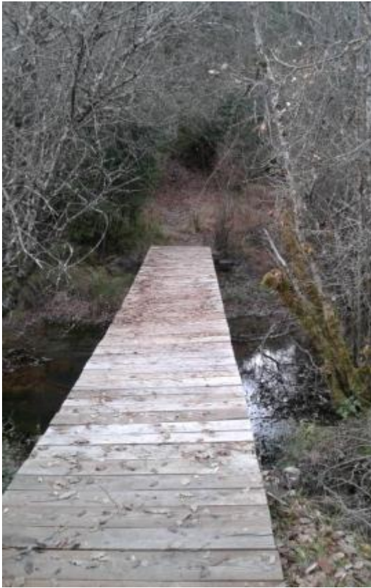
8. Puente en Xiringoa/ Xiringoko zubia